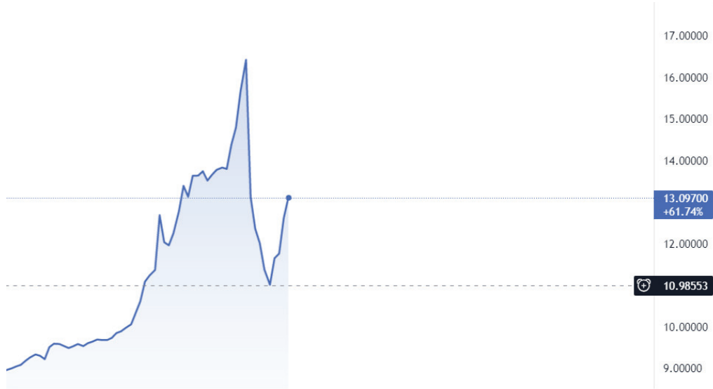
الرسم البياني 2 - تغير قيمة الليرة التركية إلى الدولار الأمريكي

شهدت تركيا تقلباً في العملة بسبب السياسة الاقتصادية التي أعلنها الرئيس أردوغان ، والتي كانت تتعلق بالفائدة والتضخم. بعد إزالة مناصب عليا من البيروقراطية الاقتصادية من مناصبهم، انخفضت قيمة الليرة التركية بشكل حاد في أسبوعين في نهاية تشرين الثاني. من ناحية أخرى ، تم تحديد هذه السياسة كنموذج جديد يشير إلى التجربة الصينية بسبب انخفاض قيمة الليرة والسعي لبدء استراتيجية إنتاج وتصدير. أدى النموذج الاقتصادي إلى زيادة التضخم في تركيا على الرغم من زيادة الصادرات والتوظيف بشكل كبير بينما عانت القاعدة الواسعة للمجتمع من انخفاض الدخل وزيادة الأسعار في الأسواق. كانت مفاجأة أردوغان هي ربط استثمار الليرة في البنوك بالدولار الأمريكي. ووعدت الحكومة بتعويض خسارة المواطنين الأتراك في حال تضررهم من تقلبات العملة مقارنة بالودائع القائمة على الفائدة في البنوك. هذه الخطوة فجأة قدرت قيمة الليرة التركية في يوم واحد. يوضح الرسم البياني التالي تغيير قيمة الليرة التركية إلى الدولار الأمريكي (الرسم البياني 2).